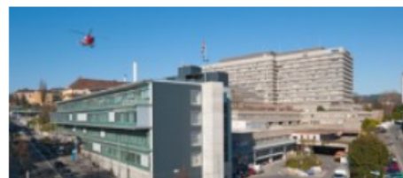
Centre hospitalier universitaire vaudois