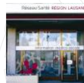
BRIO du RSRL