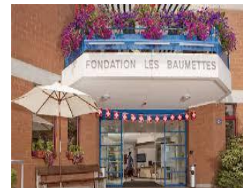
EMS des Baumettes