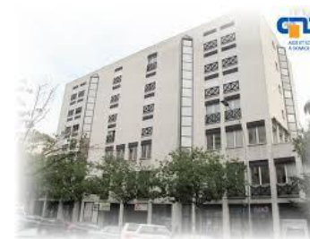
CMS de Renens Nord