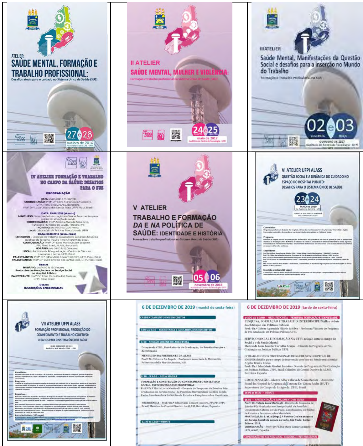
Figure 1 - Affiches pour la diffusion de la série historique des sept Ateliers UFPI ALASS Brésil qui ont été produites entre les mois d'octobre 2016 et décembre 2019.