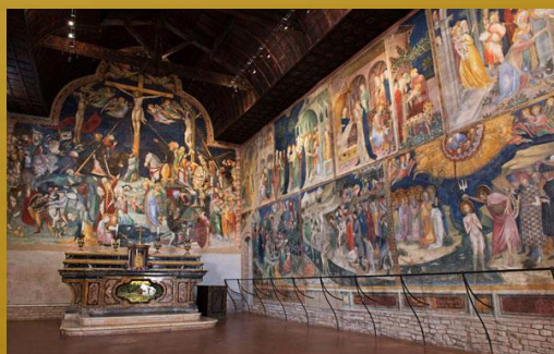
ORATORIO SAN GIOVANNI