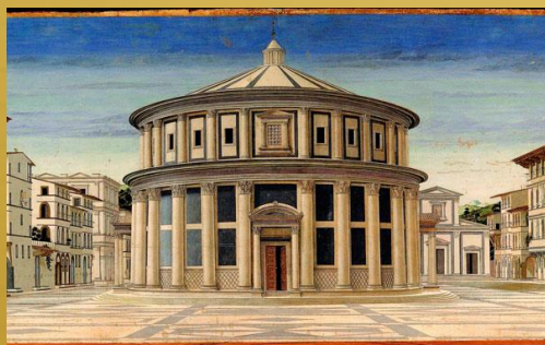
GALERIE NATIONALE DU MARCHE

Le tour - avant de revenir à Ancône à 20h30 - a un coût de 20 euros par personne et comprend: Aller-retour de Ancone; Guide italien / français qui présentera les principaux monuments du patrimoine historique de l'UNESCO.