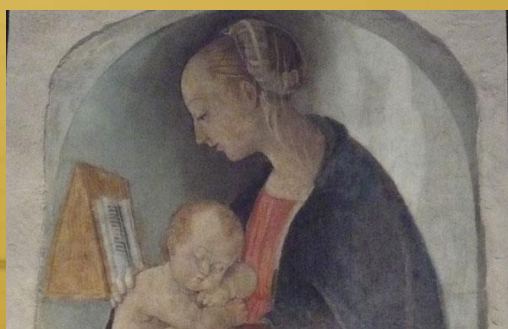
MAISON DE RAPHAËL

Les participants seront libres de visiter le Palais Ducal, la cathédrale d'Urbino, la maison de Raphaël ect.